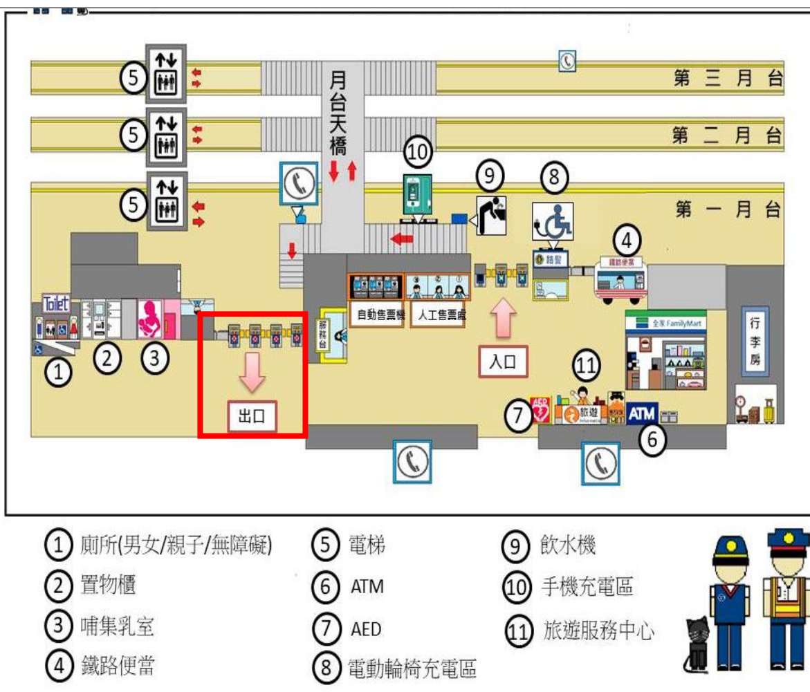
彰化台鐵接駁地點示意圖