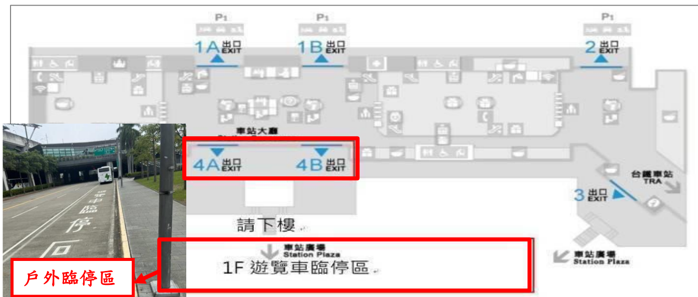
臺中高鐵接駁地點示意圖