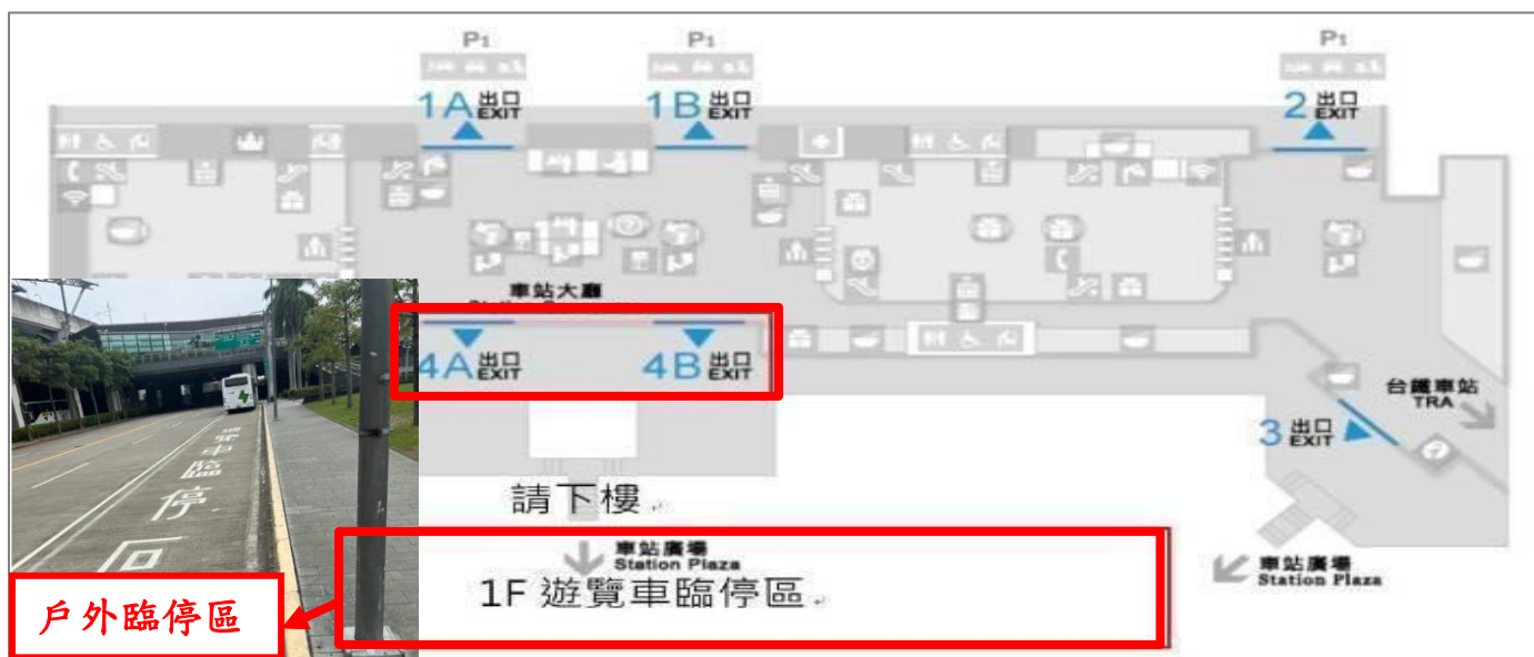
臺中高鐵接駁地點示意圖